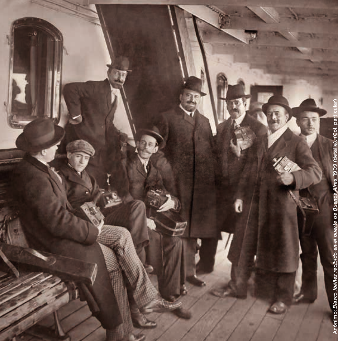
Anónimo: Blasco Ibañez recibido en el puerto de Buenos Aires, 1909 (detalle). (Col. particular)

A través de la obra de los fotógrafos más relevantes de su tiempo, "El Rostro de las Letras" recorre más de un siglo de historia de la fotografía y la literatura en España, desde el año en que se hizo público el invento del daguerrotipo en 1839 hasta los días postreros de los miembros de la Generación de 1914.